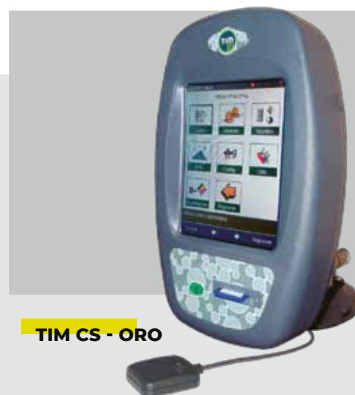
TIM CS - ORO