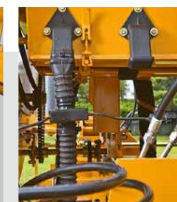
SENSOR DE FERTILIZANTE POR CHORRILLO